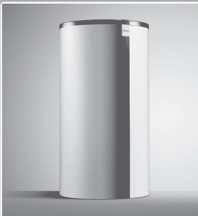
Zasobnik buforowy allSTOR